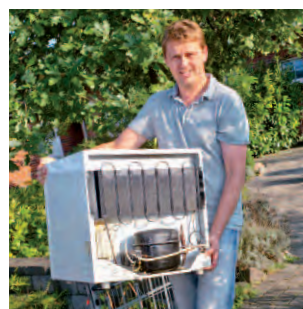
Erlöse aus Wertstoffen Sie haben's in der Hand! Seite 5