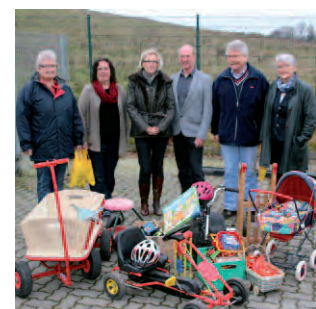
Aktion „Nachspielzeit“ Altes Spielzeug in neue Hände! Seite 7