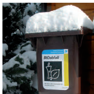
Organische Abfälle in die Biotonne Kneifen gilt nicht! Seite 3

Wir wünschen allen unseren Kunden einen guten Rutsch und ein gesundes neues Jahr!