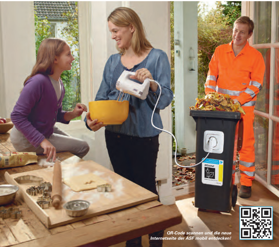
QR-Code scannen und die neue Internetseite der ASF mobil entdecken!