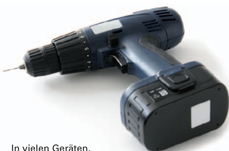
In vielen Geräten, die wir jeden Tag nutzen, stecken Lithiumbatterien.

Muss der Turnschuh wirklich blinken, der Teddy sprechen, die Grußkarte singen? Zusätzlich zur Schwermetallbelastung fällt nämlich auch die Energiebilanz von Batterien deutlich negativ aus. So wird bei der Herstellung von Batterien 40- bis 500-mal mehr Energie eingesetzt, als aus der Batterie gezogen wird. Daher lohnt es sich, gezielt nach Produkten zu suchen, die ohne Batterien funktionieren.