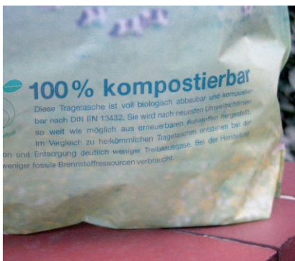
100 Prozent kompostierbar bedeutet nicht automatisch, dass das Material für die Bioabfallbehandlungsanlage geeignet ist.