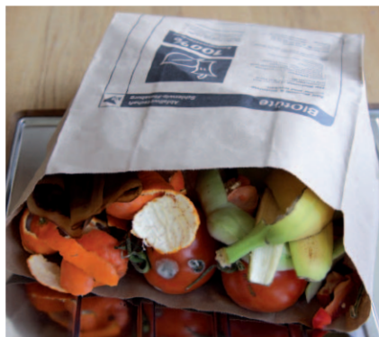
Die praktischen ASF-Biotüten aus stabilem und schnell kompostierbarem Kraftpapier eignen sich bestens für Ihre Bioabfälle.

Wer seine Bioabfälle sauber und umweltfreundlich sammeln möchte, sollte entweder auf Zeitungspapier zum Einwickeln oder auf die ASF-Biotüten aus stabilem Recyclingpapier setzen. Diese zersetzen sich bei der Kompostierung rückstandsfrei innerhalb kürzester Zeit.