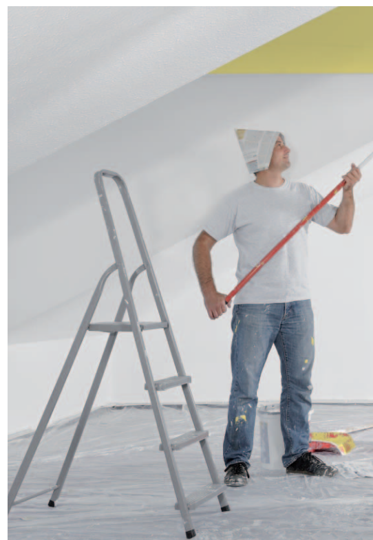
Bei einem Umzug und der Renovierung fallen meist viele unterschiedliche Abfälle an.

... sind Bauabfälle und können auf den Recyclinghöfen kostenpflichtig entsorgt werden.